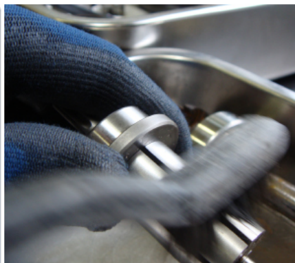
⑤ エアモーターのオーバーホール作業