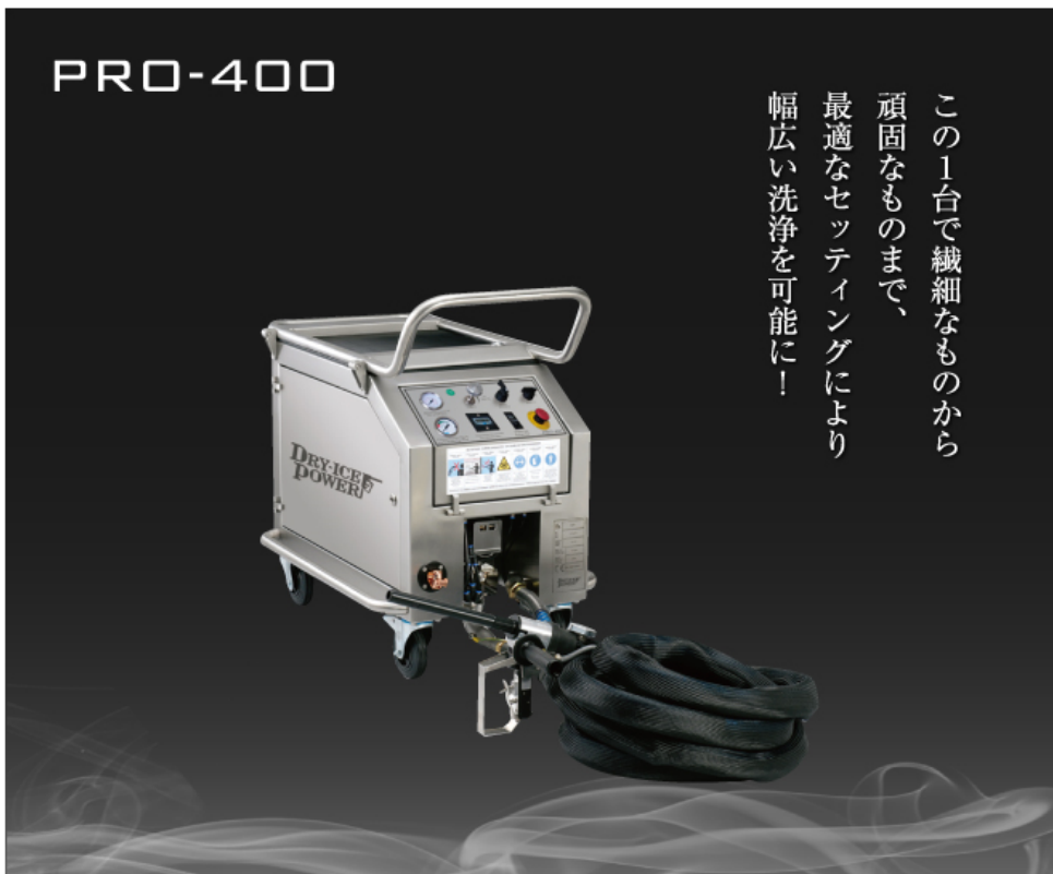
PRO-400<ドライアイスペレット・ドライアイスパウダー洗浄方式> デュアルホースシステム (エアモーター仕様)

この1台で繊細なものから 頑固なものまで、 最適なセッティングにより 幅広い洗浄を可能に！